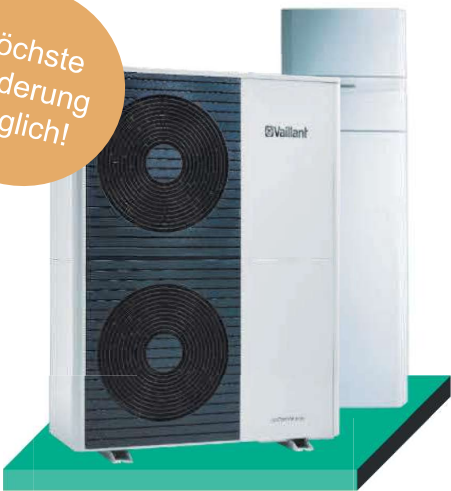
aroTHERM plus 12 kW, flexoCOMPACT