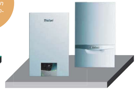
ecoTEC exclusive, ecoTEC plus

Solar/WP muss innerhalb von 2 Jahren nachgerüstet werden.