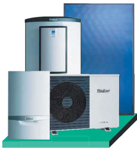
ecoTEC plus, aroTHERM plus 5 kW, allSTOR, auroPOWER

inkl. 10% zusätzlichen Bonus, bei Austausch einer Ölheizung