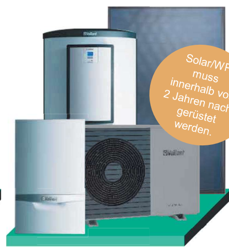
ecoTEC plus, aroTHERM plus 5 kW, allSTOR, auroPOWER

inkl. 10% zusätzlichen Bonus, bei Austausch einer Ölheizung